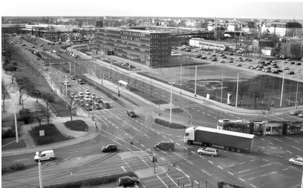
Cottbus von oben! Wer das Bürohaus besucht, sollte sich die Zeit nehmen, aus der obersten Etage einen Blick in das westliche Cottbus zu werfen. Das neue Knappschaftsgebäude und der Bahnhof, aber auch der Ortsteil Ströbitz sind dabei gut zu erkennen. Der Fotoapparat sollte aber dabei sein...